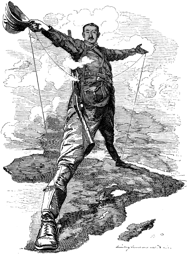
Karikatur aus dem Jahr 1892