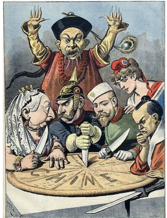
Karikatur aus den 1890ern: Die europäischen Mächte und Japan streiten um China