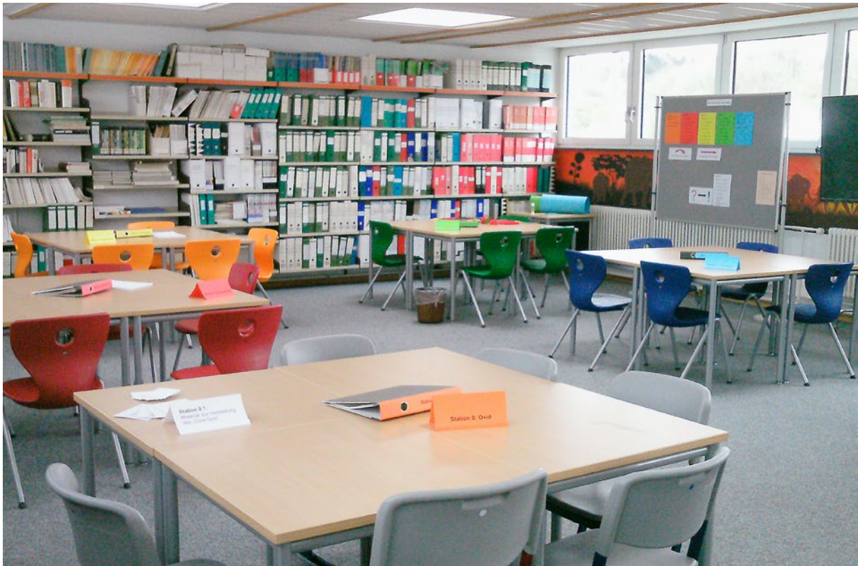
Möglicher Aufbau des Lernzirkels

hen Sie sich während der Schüler/innenarbeitsphase möglichst ganz zurück. Halten Sie die Lernenden dazu an, eventuell auftretende Fragen untereinander zu klären. Des Weiteren sollten Sie den Schüler/innen die Möglichkeit geben, Unklarheiten in einem »Fragenspeicher« (z. B. an der Tafel) zu vermerken, der regelmäßig von Ihnen ausgewertet wird.