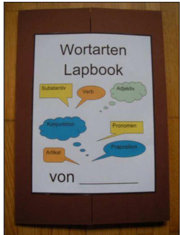
Foto von außen