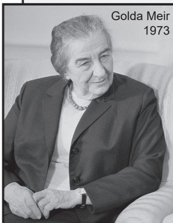
Golda Meir 1973

Die Antworten fielen entsprechend der zionistischen Ausrichtung der maßgebenden Politiker klar aus: es sollte keinen palästinensischen Staat geben. Die israelische Führung war nicht einmal bereit, sich mit den Problemen der Palästinenser zu beschäftigen.