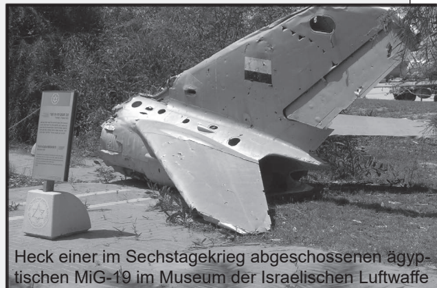
Heck einer im Sechstagekrieg abgeschossenen ägyptischen MiG-19 im Museum der Israelischen Luftwaffe

Der strahlende Sieger Israel konnte es sich leisten, Milde walten zu lassen gegenüber den insgesamt nun 1,2 Millionen Palästinensern unter seiner Herrschaft. Es wurden zwar schnell nach dem Krieg im Gaza-Streifen und im Westjordanland Militärverwaltungen aufgebaut, doch einer systematischen Verfolgung waren die Palästinenser in dieser Zeit nicht ausgesetzt. Außerdem versuchte Israel die Wirtschaft der Westbank in die eigene israelische Wirtschaft zu integrieren. Zugleich sollte mit einer „Politik der offenen Brücken“ der Import aus und der Export nach Jordanien sowie den anderen arabischen Staaten gesichert werden. Israel versprach sich dadurch einen umfassenden Zugang zu den arabischen Märkten, auf denen israelische Produkte sonst boykottiert wurden. Die Wirtschaftspolitik Israels in den besetzten Gebieten war erfolgreich, machte sie aber wirtschaftlich von Israel abhängig.