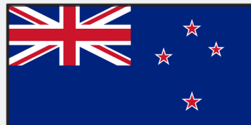
Drittgrößter Staat des Erdteils: Neuseeland