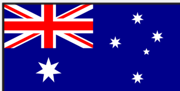
Größter Staat des Erdteils: Australien