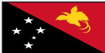
Zweitgrößter Staat des Erdteils: Papua-Neuguinea