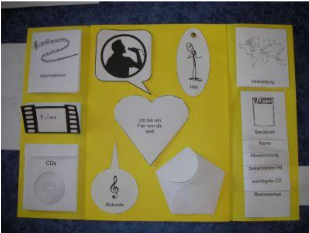
Foto außen Faltung