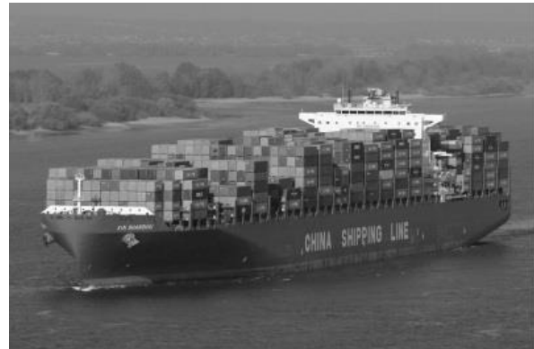
Containerschiff auf der Elbe vor Hamburg

Der Transport über den Seeweg mit Hilfe von Containern ist heute sehr wichtig für die Verteilung von Waren über die gesamte Welt. Auf dem Seeweg wurden 2014 - nach Angaben der International Chamber of Shipping (ICS) – etwa 90 Prozent des grenzüberschreitenden Warenhandels transportiert. Vor allem wegen der vergleichsweise relativ geringen Frachtkosten ist die Bedeutung der Seefracht in den letzten Jahren