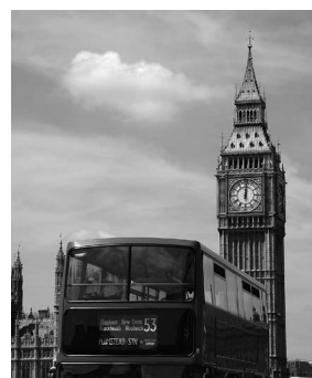
Take a seat on one of the double-decker buses.

As we continue our journey you can already hear our next destination. It's famous _____ (2). The bus will stop now to give you a chance to take a picture of the _____ (3), the meeting place for the House of Lords and the House of Commons. On your right you can see _____ (4). This is where coronations and royal weddings take place. Maybe you saw the wedding of Prince William and Kate Middleton on TV.