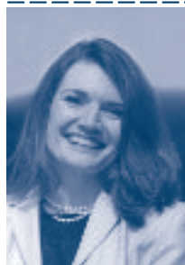
Jeannette Walls im Jahr 2009