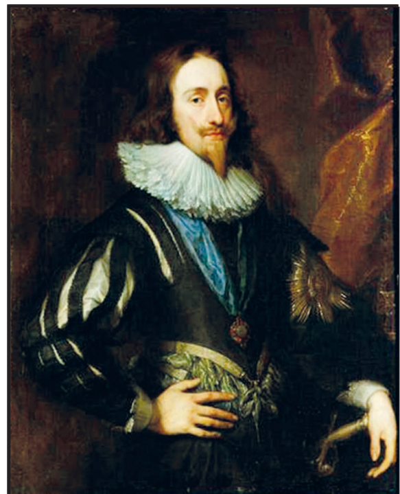
König Karl I. von England