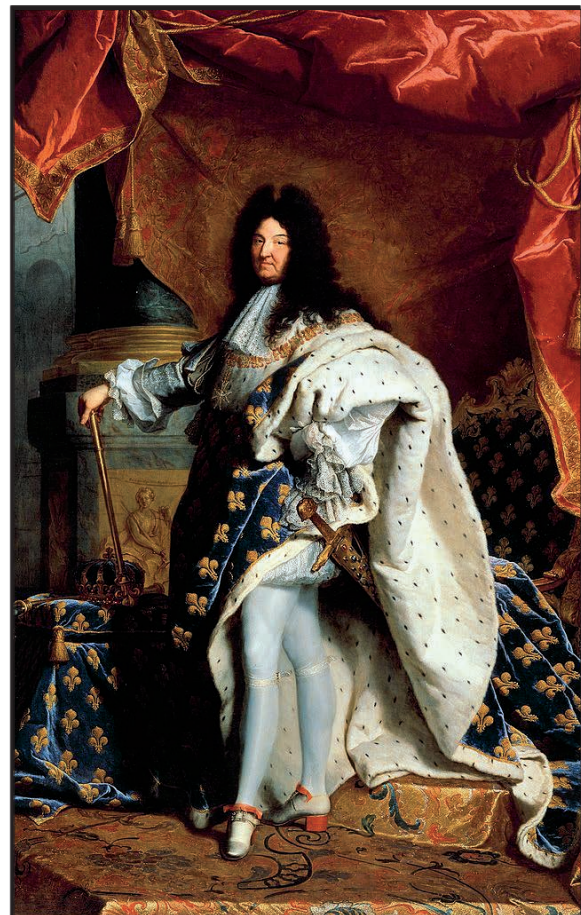
König Ludwig XIV.

69 Die Wirtschaftspolitik des Absolutismus war der _____. 70 Er diente der Vermehrung der _____. Viele Waren 71 ließ man nicht mehr von Handwerkern herstellen, sondern in Großbetrieben, die man 72 _____ nannte. Das steigerte die Warenproduktion. Der 73 Export nahm zu, der Import ging drastisch zurück.