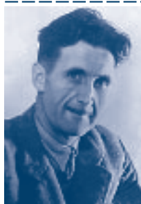
George Orwell 1903–1950