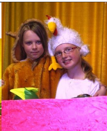
Fuchs und Huhn