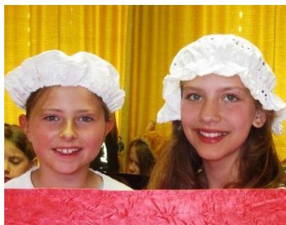
Köchin und Service