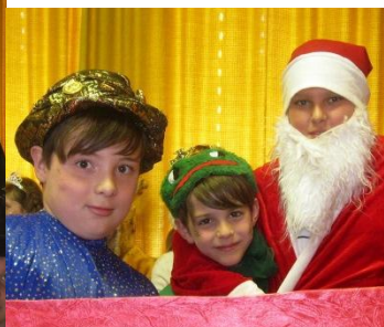
König, Frosch/Prinz, Weihnachtsmann