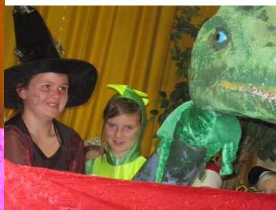
Hexe und Dino Langhals