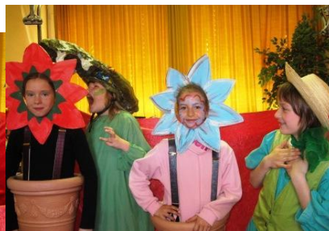
2 Modelblumen, Dino Raptor, Gärtnerin