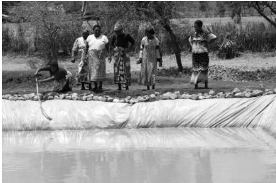
Frauen in Kenia kümmern sich um die Fischzucht

Die Organisation „Welthungerhilfe“ geht davon aus, dass sich bei einer Gleichstellung von Frau und Mann Hunger und Armut um ein Vielfaches reduzieren ließen. Die „Welthungerhilfe“ nennt 100 bis 150 Millionen Hungernde weniger als ein realistisches Ziel. Um zu erreichen, dass weniger Menschen von Hunger betroffen sind, müsste Frauen, die in der Landwirtschaft tätig sind, jedoch der gleiche Zugang zu Landbesitz, Krediten und Bildung ermöglicht