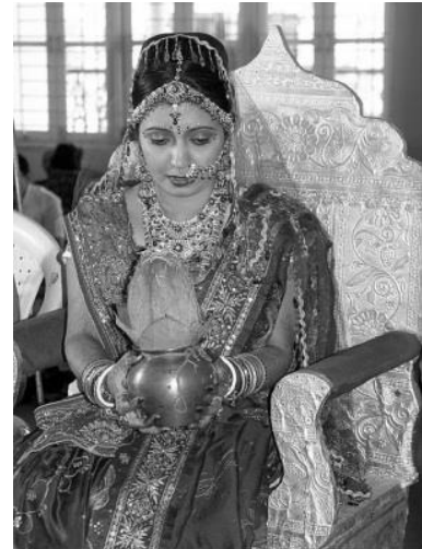
Indische Braut in einer hinduistischen Heiratszeremonie

Die Ursachen für diese Unterdrückung des weiblichen Geschlechts liegen beispielsweise in Auslegungen des Hinduismus. In dieser Religion haben männliche Nachkommen traditionell einen höheren Stellenwert. Ein weiterer Grund liegt im starren Kastensystem, das in Indien noch immer verankert ist und die Frau stark vom Mann abhängig macht. Vor der Gründung des indischen Staates war der Subkontinent zudem in mehrere kleinere Königreiche aufgeteilt. Die unterschiedlichen Regelungen zum Bildungswesen werden auch heute noch von den einzelnen Unionsstaaten erlassen. Daher ist die Rolle der Frau dort sehr unterschiedlich zu bewerten. Die lange britische Kolonialherrschaft trug ebenfalls zum Problem bei, vor allem die männlichen Eliten Indiens zu stärken.