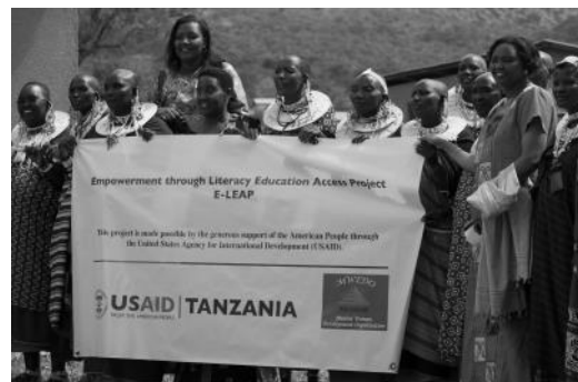
Frauen in Tansania nehmen an einem Kurs zur Verbesserung ihrer Swahili Schreibkenntnisse teil

Anhand der Alphabetisierungsrate zeigt sich besonders deutlich, dass Frauen in Sachen Bildung benachteiligt sind: Global können ca. 775 Millionen Menschen weder lesen noch schreiben. Insgesamt sind davon erheblich mehr Frauen als Männer betroffen (etwa 2/3 Frauenanteil). Vor allem in Süd- und Westasien gehen zwischen 55% und 65% aller Mädchen nicht zur Schule . Der Grund liegt gerade in den Entwicklungsländern häufig in den oft sehr traditionellen und kulturellen Strukturen ,