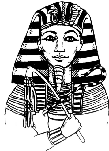
Herrscher im Alten Ägypten: der Pharao

Mit abwechslungsreichen Materialien lernen die Schülerinnen und Schüler interessengeleitet verschiedene Aspekte aus dem Alltagsleben der Alten Ägypter kennen – sei es die Schrift, die Malerei oder die Papyrusherstellung.