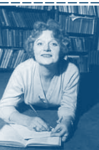
Muriel Spark (1918–2006), Mai 1960