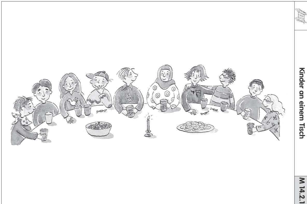
Kinder an einem Tisch