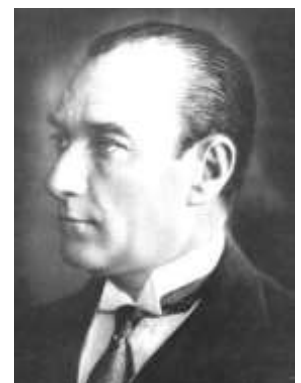
Mustafa Kemal Atatürk, der Gründer des türkischen Staates

Im 19. Jahrhundert begann jedoch der langsame Niedergang des Osmanischen Reiches. Sein endgültiger Zerfall begann, nachdem es 1914 an der Seite von Deutschland und Österreich-Ungarn in den _____ eingetreten war. Die Niederlagen gegen die Alliierten und Rebellionen in Arabien ließen das Reich zerfallen und zwangen es 1918 zur Kapitulation. Während die Sieger planten, das Reich zu zerstückeln und Teile der heutigen Türkei an Griechenland zu übergeben, organisierte der türkische Nationalist und _____ Mustafa Kemal von Ankara aus politischen und militärischen _____ gegen diese Pläne.