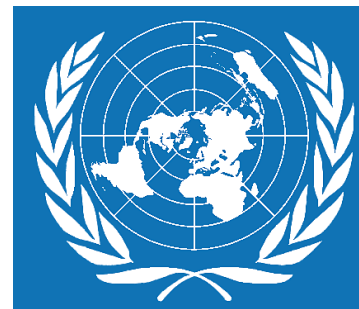
Das Logo der UN

Die Charta der UN wurde auf der Gründungskonferenz in San Francisco (25.4.-26.6.1945) ausgearbeitet, die dann zum Ende der Konferenz von fünfzig teilnehmenden Staaten unterzeichnet wurde. Mit der Ratifizierung durch die Mehrheit der Unterzeichnerstaaten trat diese am 24.10.1945 in Kraft.