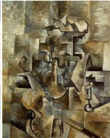
George Braque „Viole und Kerze“ 1910, Öl auf Leinwand. MOMA Francisco.

Lyonel mochte den Stil. Das rechte Bild zeigt einen Tiger, der aus Drei- und Vierecken besteht. Auf dem rechten Bild kann man nur sehr schwer die Violine und die Kerze erkennen. Sie scheinen wie ein Foto in kleine Schnipsel zerlegt worden zu sein, die auf dem ganzen Blatt verteilt sind. Findet ihr sie?