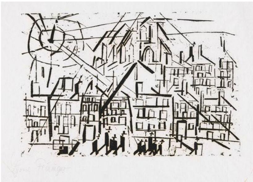
„Stadt mit Kirche in der Sonne“, 1918. Holzschnitt.