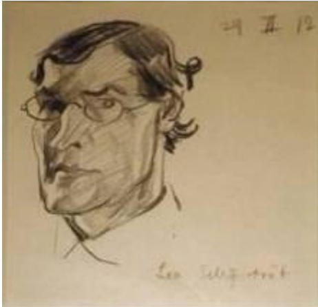
Selbstporträt, 1912. Achim Moeller Fine Art, New York.

Lyonel Feininger (sprich: „Leionel Feininger“) wurde 1871 als Kind von einem Geiger und einer Pianistin in New York geboren. Sein Vater brachte ihm zwar das Geigen bei, aber er schien sich schon früh für die Kunst entschieden zu haben: Seine berufsbedingt reisefreudigen Eltern ließen ihn in Hamburg, Berlin und Paris das Zeichnen lernen. Als 22-jähriger brach er sein Studium ab, und begann als Karikaturist und freier Illustrator für Magazine zu arbeiten.