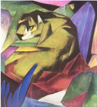
Franz Marc „Der Tiger“, 1912. Öl auf Leinwand.