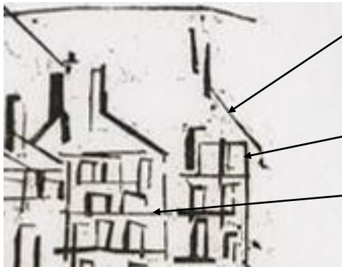
„Stadt mit Kirche in der Sonne“, Ausschnitt, 1918. Holzschnitt

Lyonel hat nicht mit Flächen, sondern mit Linien gearbeitet! Aus mehreren Linien kann man eine Form zusammensetzen. Aber wie hat er die Linie gesetzt, wie genau hat er gezeichnet?