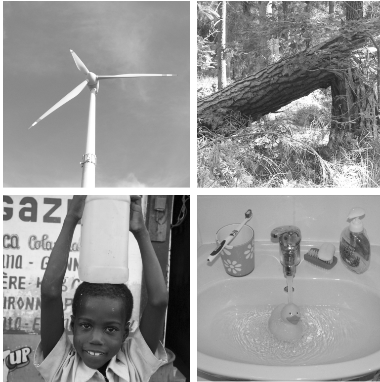
Gebrauchen und verbrauchen – ein Memory zum Thema „Schöpfung“