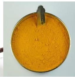
Kurkuma

Viele Maler haben aber nicht nur einfach die Farben gekauft und benutzt, sondern auch über sie nachgedacht. Einer von ihnen war Phillip Otto Runge , ein Maler der Romantik. Zusammen mit Johann Wolfgang von Goethe hat er überlegt, wie man die vielen Farben der Welt ordnen könnte. Dabei kam er auf die Idee, die Farben auf einer Kugel darzustellen, da sie ja alle ineinander übergehen.