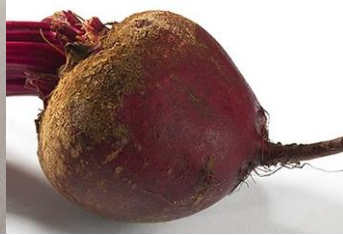
Rote Beete