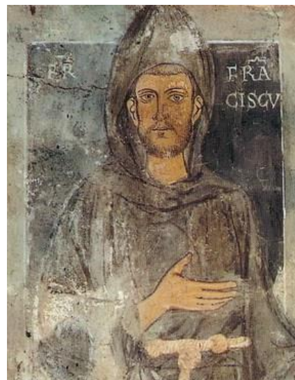
Portrait von Franz von Assisi

seine Zeit als Prediger: - Giovanni fängt an, in Armut zu leben, pflegt Leprakranke und unternimmt schließlich eine Wallfahrt nach Rom - wegen seines Lebenswandels wird er verspottet und gerät in Streit mit seinem Vater - daraufhin soll er eine Stimme gehört haben, die ihm befohlen hat, in die Welt zu gehen und im Sinne Jesu Gutes zu tun - er beginnt zu predigen und gründet mit seinen zwölf Aposteln schließlich den Franziskanerorden, von welchem er das Oberhaupt ist (Erster Orden der Franziskaner) - Giovanni findet schnell Anhänger, da sich viele nach einem neuen Leben sehnen und dieses im christlichen Glauben finden - weiterhin ist er für die Wiederherstellung zerstörter Kirchen verantwortlich und wird von den Menschen verehrt und gefeiert - als er mit Klara von Assisi die erste Frau in den Orden aufnimmt, entsteht die Schwesterngemeinschaft der Klarissinen (Zweiter Orden) - er predigt in Frankreich, Spanien und im Rahmen des 5. Kreuzzuges in Ägypten - Giovanni gründet den Dritten Orden und Regeln werden eingeführt - Franziskanermönche gelten für viele andere Orden als Vorbild