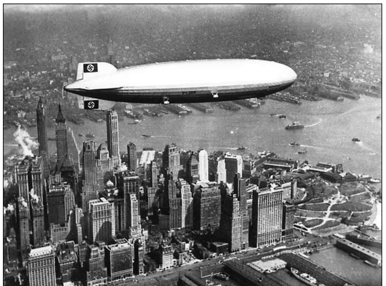
Das Luftschiff „Hindenburg“ hatte eine Länge von 246,7 m. Der größte Durchmesser betrug 41,2 m und das Gewicht etwa 215 t.