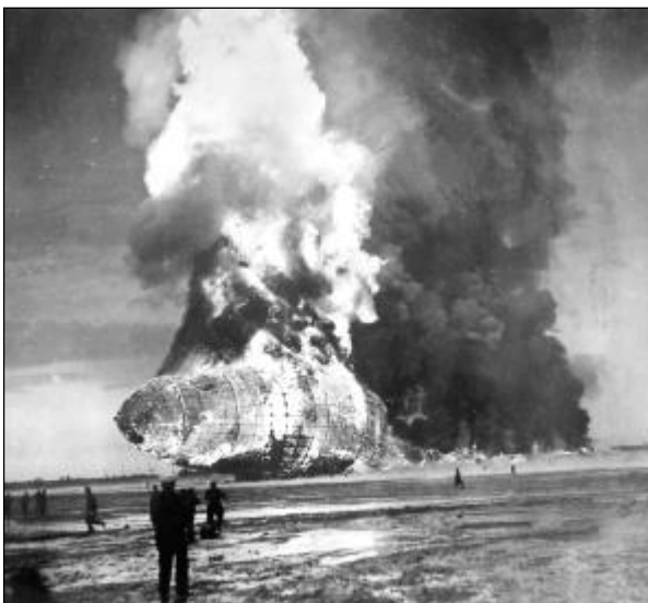
Katastrophe bei der Landung der LZ 129 in Lakehurst