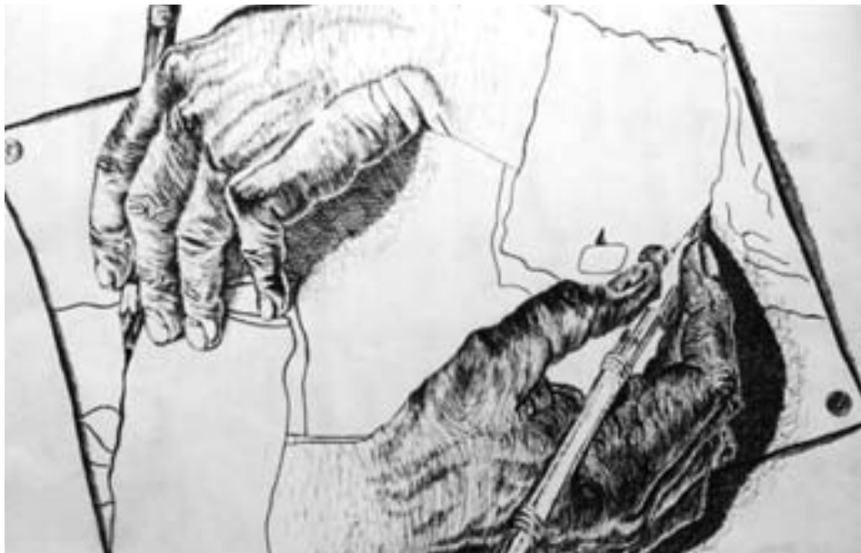
Schülerarbeit nach Escher