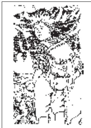
Durchführung eines Wandertags