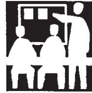
Gestaltung einer Ausstellung