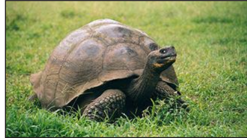
Galápagos-Riesenschildkröte ( Geochelone nigra porteri )

Die Galápagos-Riesenschildkröte, die auf pazifischen Inseln 1000 km westlich der ecuadorianischen Küste lebt, gehört zu den größten Landschildkröten und wird stattliche 200 kg schwer und über 1 Meter lang. Sie lebt in unterschiedlicher Vegetation, z.B. in trockenem Tiefland oder tropischem Wald. Die Weibchen wandern zur Eiablage zu den wärmeren Küstengebieten, in denen auch die Jungtiere aufwachsen. Sie ernähren sich z.B. von Gräsern, Kräutern, Beeren, Kakteen oder Flechten. Je nach Ernährung sind die Panzer unterschiedlich geformt, daher unterscheidet man verschiedene Arten der Riesenschildkröte. Sie können über 100 Jahre alt werden.