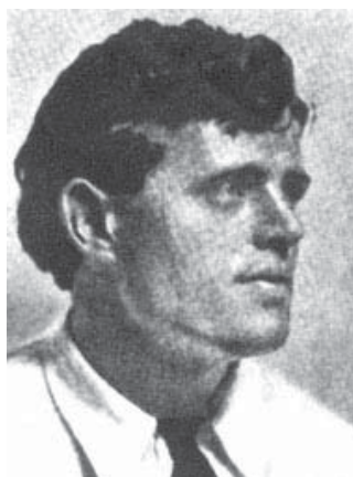
Jack London (1876-1916)