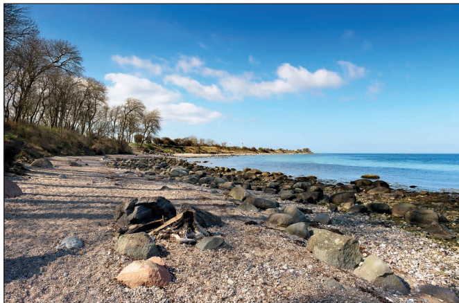
Fehmarn: Küste – Strand