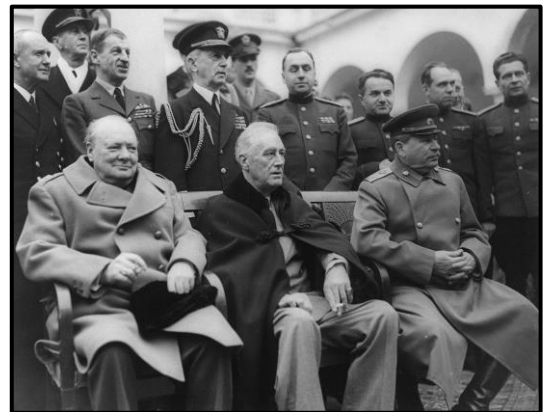
Churchill, Roosevelt und Stalin