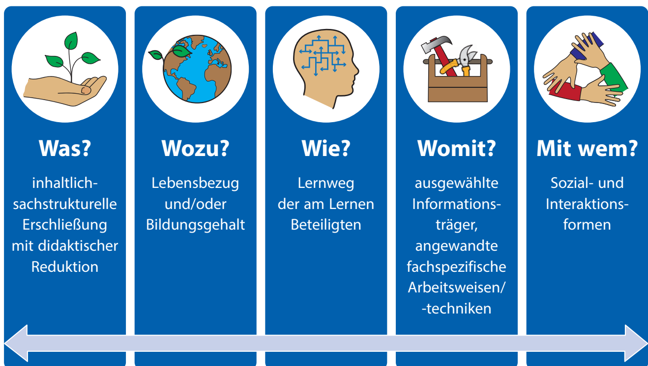
Abbildung: Didaktische Schlüsselprinzipien

Kernstück professioneller Unterrichtsvorbereitung sind die didaktischen Schlüsselprinzipien, die in gegliederter Weise für die Verfassenden Denkstrukturen und -routinen setzen, die sich positiv zeitökonomisierend auf die tägliche und verkürzte Unterrichtsvorbereitung und -gestaltung auswirken und damit einen wesentlichen Beitrag zu professionellem Lehrkräftehandeln leisten.