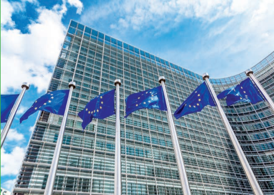
Europäisches Parlament in Straßburg