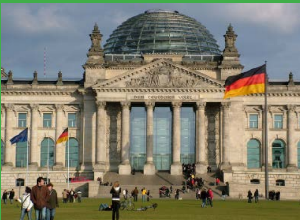
Reichstag in Berlin, Sitz des Bundestags