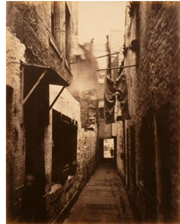
Ein Slum in Glasgow, 1871

Alle die technischen Veränderungen, die die Industrialisierung mit sich brachte, mussten zwangsläufig auch Auswirkungen auf die Lebens- und Arbeitsweise der Menschen haben. Neue Maschinen erforderten eine neue Art des Arbeiters, konstante Produktion schaffte einen völlig neuen Rhythmus im Alltag der Menschen. Durch neue Verkehrswege waren plötzlich Ziele erreichbar, die vorher undenkbar erschienen.