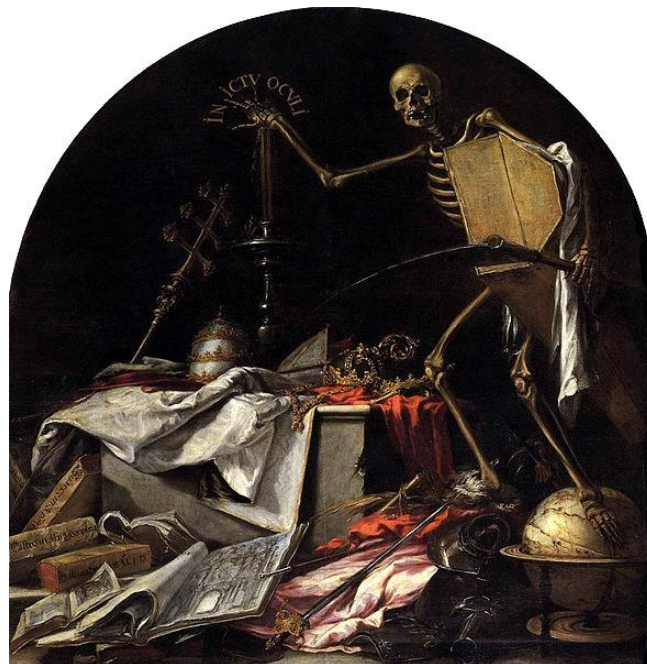
Juan de Valdés Leal – „in ictu oculi“ „In einem Augenblick“ (1672)

Als schlechte Nichtigkeit, als Schatten, Staub und Wind, Als eine Wiesenblum, die man nicht wiederfind't! Noch will, was ewig ist, kein einig Mensch betrachten!