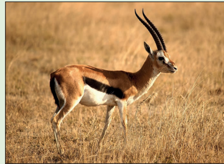
Tiere benötigen zum Atmen unbedingt Sauerstoff.

Für die Atmung aller Tiere ist das Vorhandensein von Sauerstoff eine unabdingbare Grundvoraussetzung . Es handelt sich dabei um ein farbloses, geruchsloses und geschmackloses Gas, das in der Chemie mit dem Symbol O dargestellt wird.