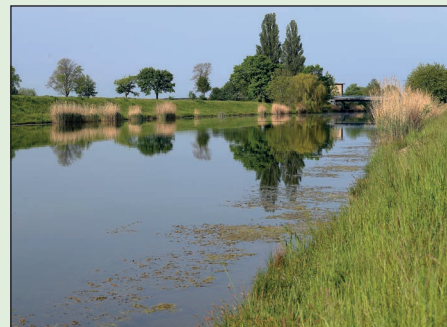
Sauerstoff befindet sich sowohl in der Luft, im Wasser als auch im Boden.

Sauerstoff lässt sich sowohl in der atmosphärischen Luft als auch im Wasser und in den oberen Bodenschichten nachweisen – allerdings in unterschiedlichen Mengen. Die höchsten Mengen werden in der atmosphärischen Luft gemessen. So enthält ein Liter Luft etwa vierzigmal so viel Sauerstoff, wie in einem Liter Meerwasser gelöst sind.