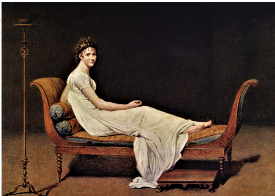
Jacques-Louis David Porträt der Madame Récamier 1800