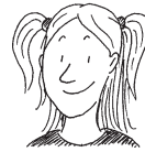
daughter (Tochter) cousin (Cousin / Cousine) niece (Nichte) granddaughter (Enkeltochter)