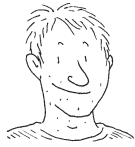
father (Vater) husband (Ehemann)