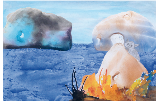
Planetenlandschaft mit Fantasietier

Die Entdeckung eines unbekanntes Wesens und die Reise zu wundersamen Planeten bilden den Rahmen dieser Unterrichtseinheit. Ausgehend von einer spannenden Geschichte werden hier Zufallsverfahren wie Frottage und Décalcomanie vermittelt und nach der spielerischen Erprobung in einer Collage miteinander kombiniert. Lassen Sie sich überraschen von den fantasievollen Planetenlandschaften, die dabei entstehen!