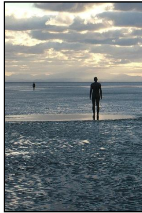
Abb.: Another Place, Crosby Beach (1997 [1995]).

Kunststil/ Epochenzugehörigkeit: Gormley gehört mittlerweile zu einem der wichtigsten Gegenwartskünstler und ist international präsent. Er gehört keiner Bildhauerschule an, ist aber allgemein dem Postminimalismus zuzuordnen, welcher durch klare und reduzierte Formensprache auf Grundstrukturen (Kugel, Dreieck, etc) zurückführt. Gormley ist inspiriert durch Richard Serra (*1939), welcher wetterfesten Stahl für minimalistische Freiplastiken einsetzt, und Land Art. Diese Kunstströmung aus dem 1960ern wandelt Natur zu künstlerisch gestaltetem Raum. Anders als bei Land Art wird von Gormley künstlich verarbeitetes Material genutzt.