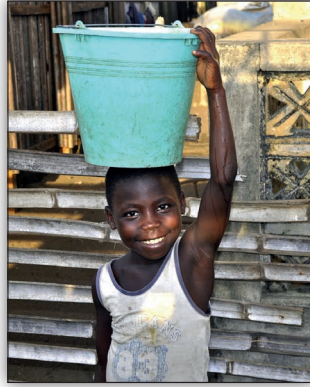
Bandele from Africa (Kenya)