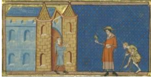
M3 - Menschen am Rande der Stadt: Bettler und Leprakranke (von links aus gesehen)