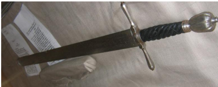
M2 Schwert eines Scharfrichters, Deutschland, 17. Jhd.

Vim Vi Repellere Licet (Es ist erlaubt, Gewalt mit Gewalt zu vertreiben). Auf der Vorderseite ist folgender Spruch eingraviert: "Wan Ich Das Schwerdt thue auffheben. So wünsch Ich Dem Sünder Das Ewige leben."