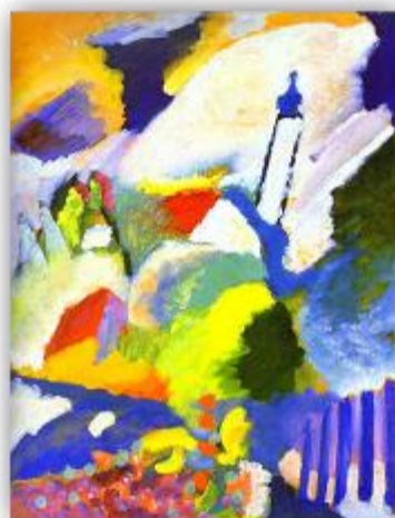
Wassily Kandinsky, 1910 Kirche in Murnau

Die letzten Jahre seines Lebens verbrachte Wassily Kandinsky mit seiner Frau in der Nähe von Paris. Sie lebten in Neuilly-sur-Seine. Dort starb Wassily Kandinsky im Jahr 1944.