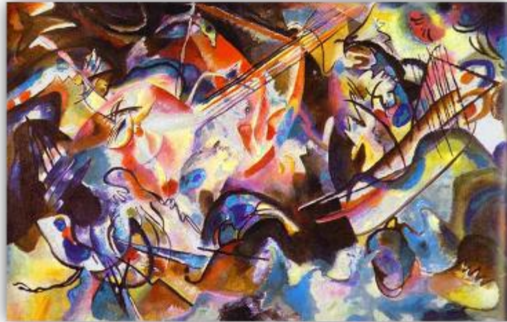
Wassily Kandinsky, 1913 Komposition VI

Wassily Kandinsky gilt bis heute als Vater der Abstrakten Kunst. Er soll der erste Maler gewesen sein, der ein Bild malte, auf dem man nicht sofort erkennen konnte, was eigentlich darauf abgebildet war. „Der Blaue Reiter“ war