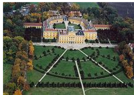
Schloss Esterháza in Ungarn