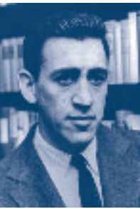
Jerome D. Salinger (1919–2010)