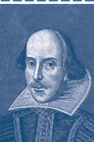
William Shakespeare 1564–1616