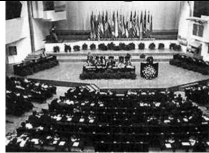
Die KSZE in Helsinki, an der 35 Staats- und Regierungschefs aus Europa und Nordamerika teilnahmen.

11. Durch die Ostpolitik war die BRD bemüht, ein Abkommen mit der Tschechoslowakei zu schließen. Am 11. Dezember 1973 wurde der Prager Vertrag unterzeichnet. Die beiden Staaten entschieden sich,