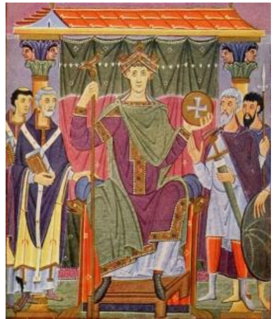
Kaiser Otto I. des Heiligen Römischen Reichs

Diesem doppelten Anspruch tragen die Macher der Serie Rechnung, indem sie sich mit der Darstellung historischer Ereignisse befassen und diese mithilfe von Animationen und durch Schauspieler nachgestellten Filmsequenzen illustrieren. Im Vergleich zu herkömmlicheren Geschichtsdokumentationen beinhaltet diese Darstellungsform einen gravierenden Unterschied: Wurden früher lediglich historische Orte, Ruinen, Kunstgegenstände und Urkunden bildlich dargestellt, so werden nun in großem Umfang historische Handlungen und Gespräche nachgespielt. In Kombination mit der dauerhaft im Hintergrund laufenden musikalischen Untermalung und den modernen schnellen Bildfolgen steigert dies den Unterhaltungswert der Serie ganz erheblich.