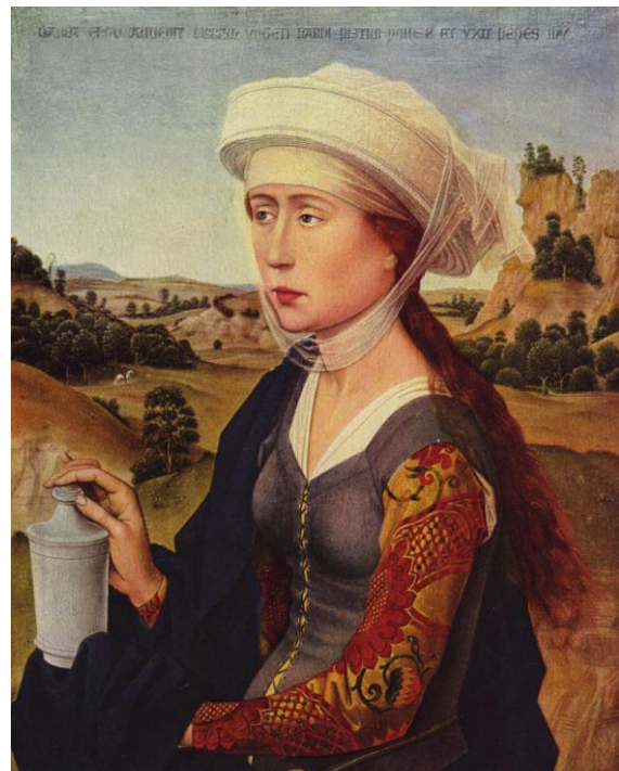
Rogier van der Weyden – Die Heilige Maria Magdalena, 1450-52

Nachdem Jesus am Kreuz gestorben war, merkte Maria am 3. Tag, dass das Grab von Jesus leer war und sie war die erste, die mitbekommen hat, dass er wieder auferstanden ist.