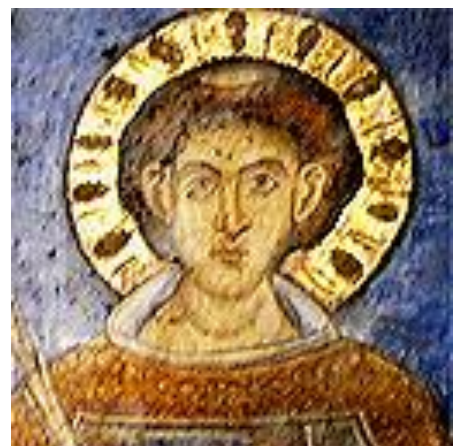
Jakob der Ältere aus einem Fresko an der Kathedrale von Le Puy-en-Valey.

Nach dem Tod von Jesus ist Jakobus vom König Herodes hingerichtet worden.