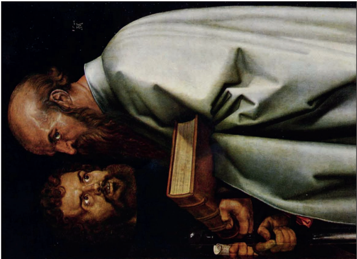
Paulus (rechts im Bild) mit Markus (links)

Um die Veränderung deutlich zu machen, die mit Saulus geschehen ist, wird er in Beschreibungen seines Lebens nach seiner Umkehr meist Paulus genannt. Das war sein römischer Name, denn Paulus war von Geburt an auch römischer Bürger. Das Land, in dem Saulus lebte, gehörte zum Römischen Weltreich. Heute tragen viele Kirchen den Namen des Apostels Paulus. Paulus wird meist mit einem Schwert dargestellt, auch mit Buch oder Schriftrolle.