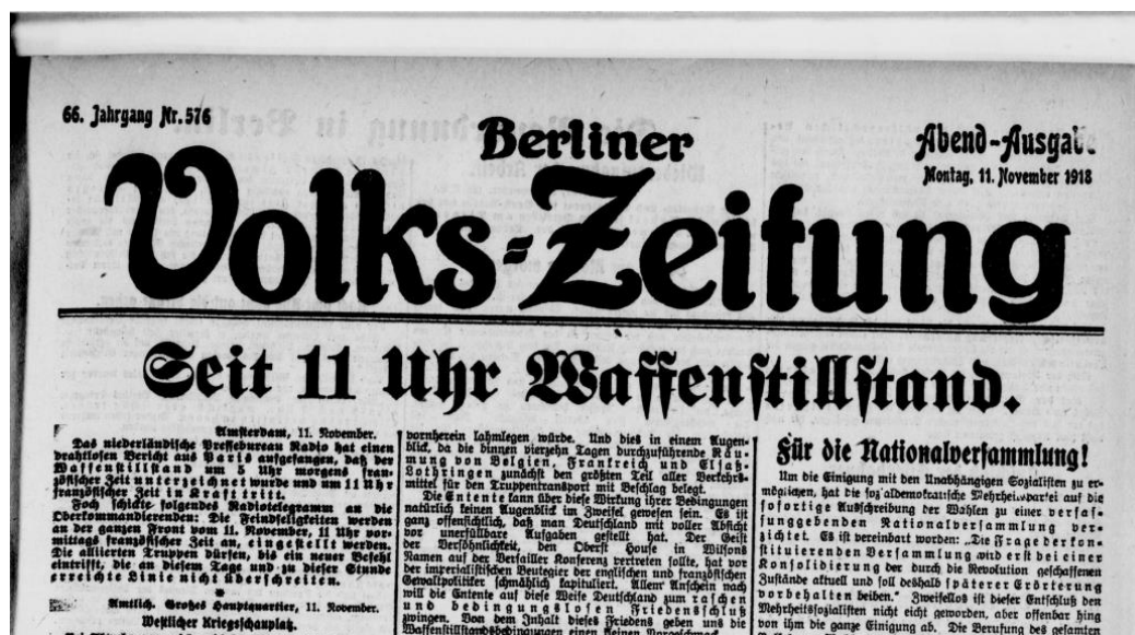
Original Zeitungsausschnitt vom 11.11.1918

In der Potsdamerstraße stehen im Halbdunkeln Menschengruppen umher und sprechen über Politik. Ein in Deutschland ungewohntes, in den demokratischen Ländern England und Amerika ganz alltägliches Bild. Dazwischen kommen Autos gesaut und werden mit Zurufen begrüßt. Ich habe den Eindruck, daß nur Neugierige wie wir selbst auf der Straße stehen. Die wirkliche Politik wird nur von wenigen Menschen hinter verschlossenen Türen betrieben und die Straße hat keinen Einfluß.