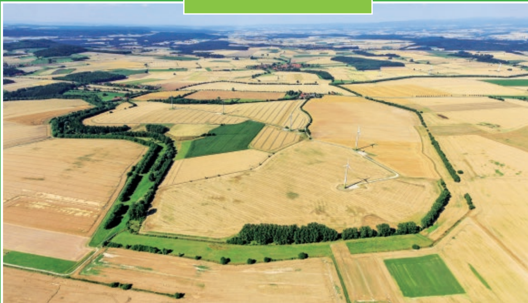
Das „grüne Band“ – vor der Wende „Todesstreifen“, heute ein Biotop