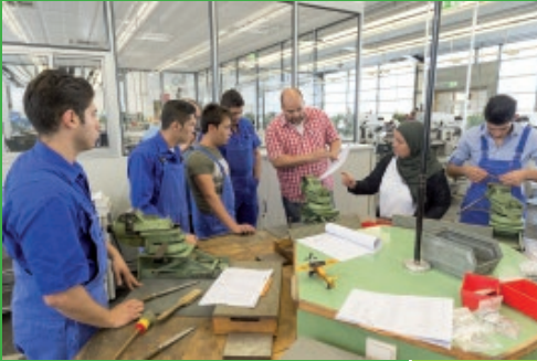
Ausbilder erläutert jungen Flüchtlingen die Arbeit